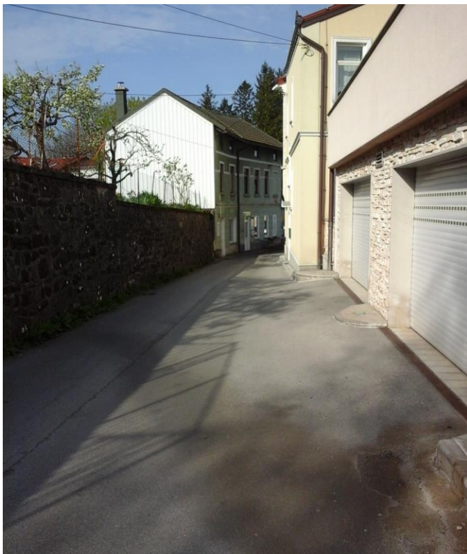
Slika 7: Adamičeva ulica