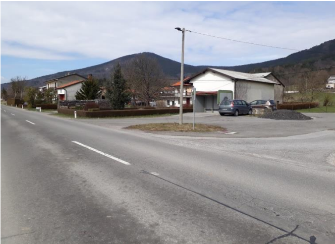
Slika 22: Vrbica

Na sliki je postajališče, kjer ustavi šolski avtobus. Nima nobene talnih oznak niti druge prometnih označbe, ki bi opozarjale na postajališče. Ker pa je mesto postajališče odmaknjeno s prometne ceste, je z vidika prometne varnosti samo slabo označeno.