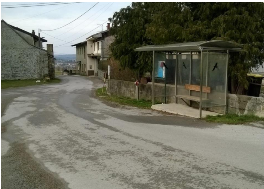
Slika 14 a: Dolnji Zemon