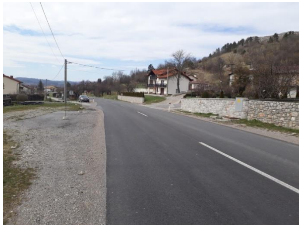
Slika 20 d

Na slikah je prikazan odsek ceste smer Zabiče – Ilirska Bistrica z mestom, kjer ustavlja šolski avtobus v obe smeri. Na fotografiji je razvidno, da postajališče ni označeno, je brez prometnih znakov in talnih označb. Mesto leži ob cesti, kjer se odvija hiter promet, zato zaključujemo, da je nevarno za uporabnike. Na tem delu odseka ni v bližini nobenega prehoda za pešce, kar otežuje varno prečkanje ceste učencem na drugi strani. Postajališče je z vidika prometne varnosti neurejeno.