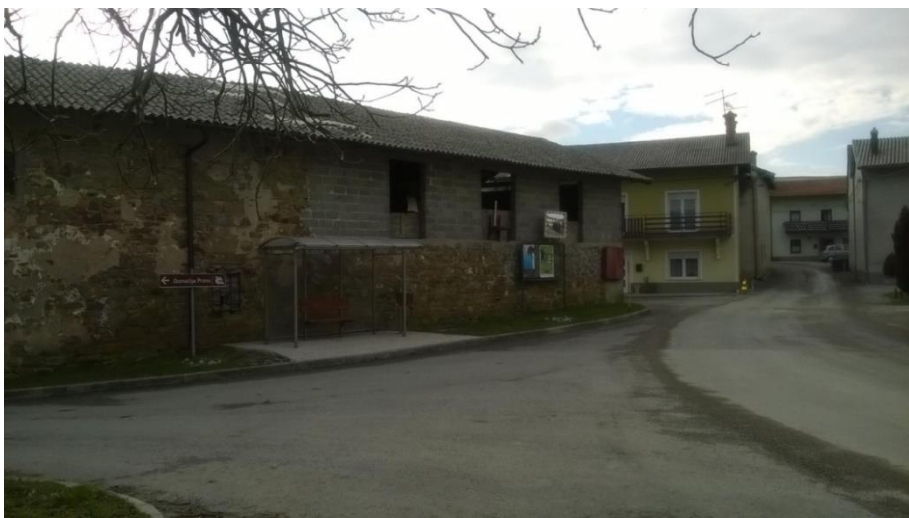
Slika 18 a: Velika Bukovica