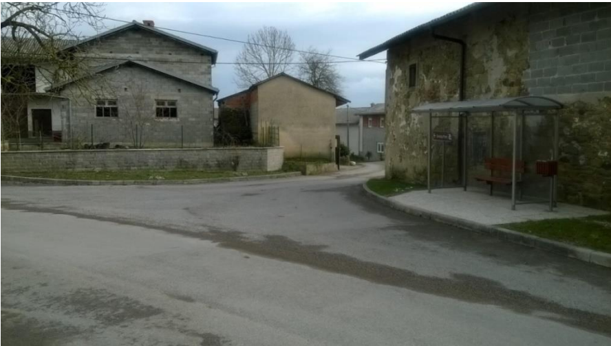
Slika 18 b: Velika Bukovica

Sliki prikazujeta postajališče na Veliki Bukovci. Ob postajališču ni pločnika, talnih označb in table.