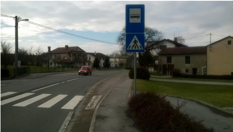
Slika 16 a: Koseze, smer Ilirska Bistrica