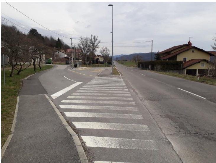
Slika 21 a: Vrbovo