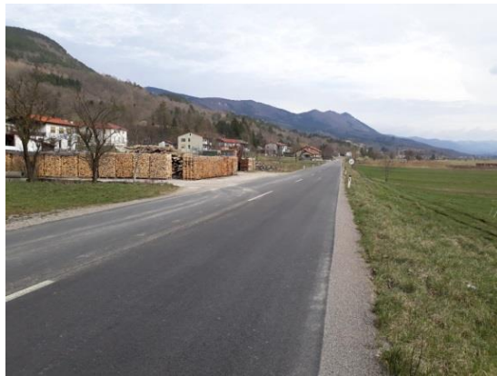
Slika 20 b