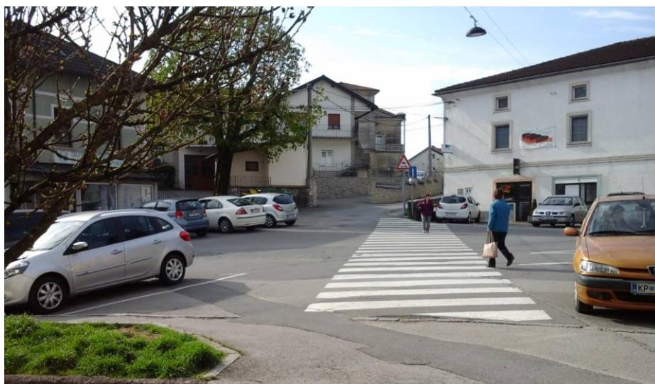
Slika 8: Stičišče Adamičeve, Cankarjeve in Rozmanove ulice

Učenci, ki prihajajo iz Adamičeve ulice nimajo zaznamovanega prehoda za pešce, po katerem bi varno nadaljevali pot do šole, po pločniku v Rozmanovi ulici.