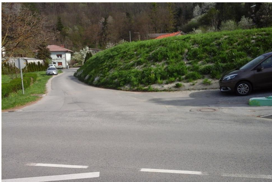
Slika 12: Rozmanova ulica

Upoštevajo naj pravila hoje v naselju, kjer ni pločnika.