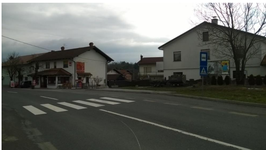
Slika 15 b: Dolnji Zemon (Zemonska Vaga), smer Jelšane

Postajališče je z vidika prometne varnosti urejeno. Ima talne označbe, obveščevalno tablo, dostop po pločniku, urejen prehod za pešce in nadstrešek. Postajališče stoji ob glavni magistralni cesti za Reko (Hrvaška), promet je povečan in se hitreje odvija.