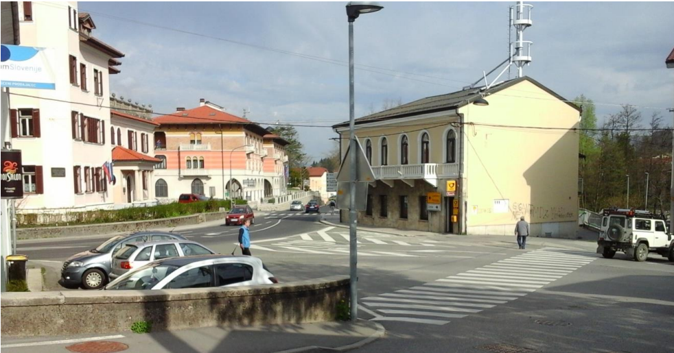
Slika 9: Prehod pred pošto

Prehod za pešce je predolg. Na tem delu cestišča je velika prometna obremenitev in prehod je delno nepregleden zaradi parkiranih avtomobilov.