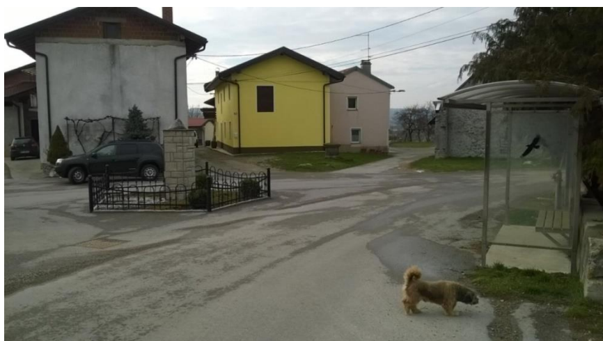
Slika 14 b: Dolnji Zemon

Sliki prikazujeta postajališče na Dolnjem Zemonu. Ob postajališču ni pločnika, talnih označb in table. Predvidevamo, da je to središče vasi, kjer je povečan promet.