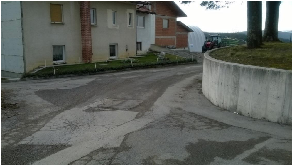
Slika 19: Soze (pri cerkvi)

Na sliki je mesto, kjer ustavi šolski avtobus. Nima nobene talne niti druge prometne označbe, ki bi opozarjale na postajališče. Postajališče je z vidika prometne varnosti neurejeno.