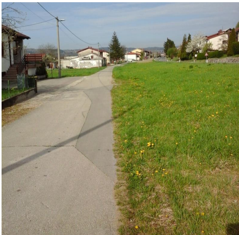
Slika 11 b: Manj prometna površina ob glavni cesti

Cesta je ozka, manj prometna vendar nima pločnika.