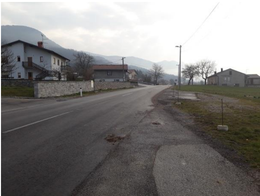
Slika 20 c