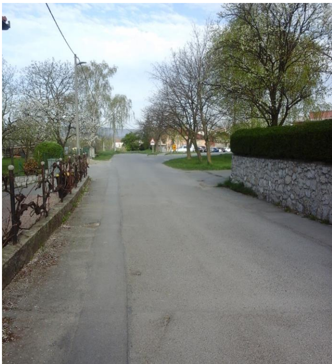
Slika 4: Del Rozmanove ulice po kateri prihajajo peš učenci iz Jasena.

Ulica je ozka in nima pločnika. Pri prehodu pešcev na pločnik, se prečka cesto, ki pelje na šolsko parkirišče. Tu ni prehoda za pešce in v jutranjih urah je ta del ceste precej obremenjen.