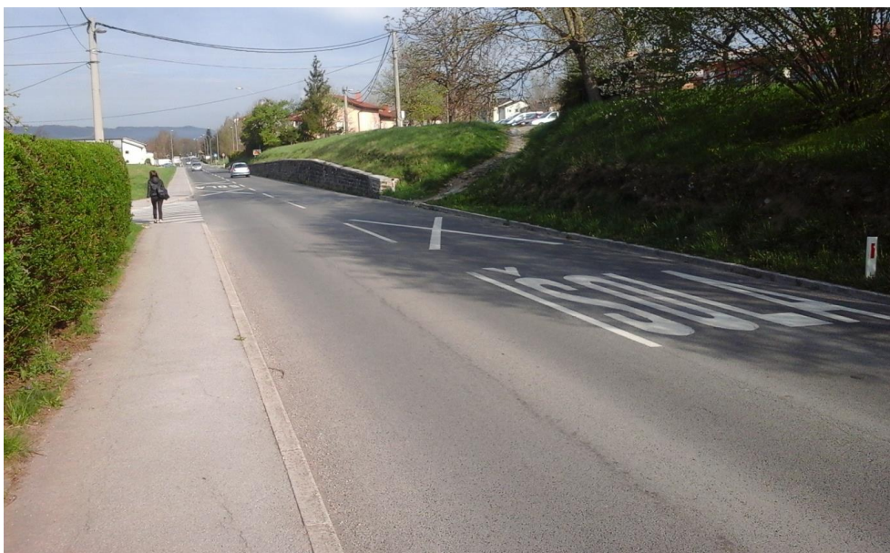
Slika 5 a: Podgrajska ulica

Pri prečkanju dela cestišča bodite previdni in se prepričajte da na cesti ni avtomobila.