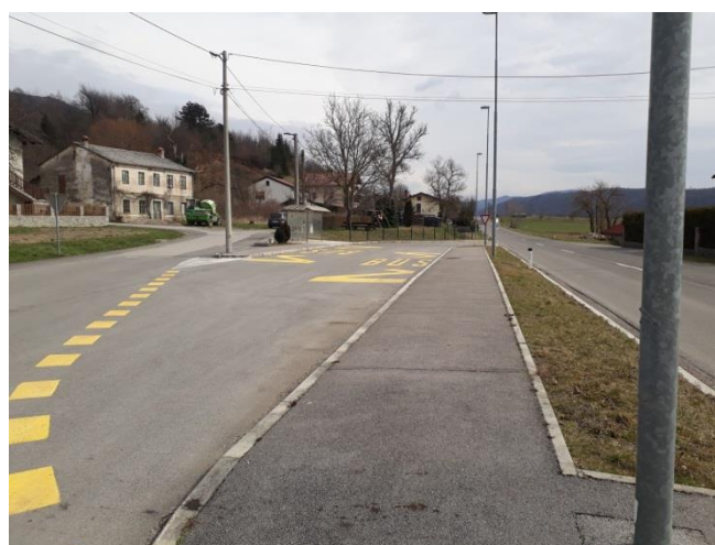
Slika 21 c: Vrbovo

Vrbovo ima urejeno postajališče, ki pa se za obe smeri nahaja na eni strani. Učenci z druge strani prometne ceste nimajo označenega prehoda za pešce.