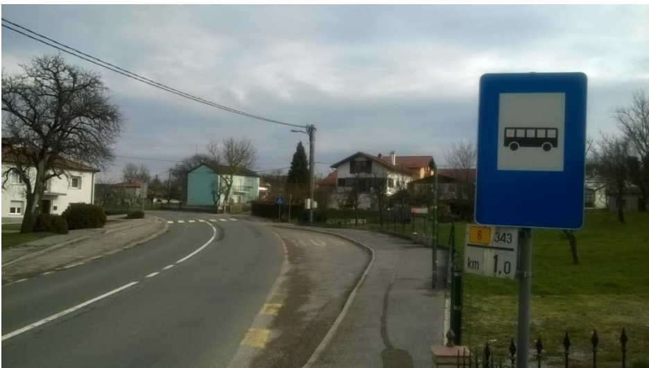
Slika 16 b: Koseze, smer Jelšane

Postajališče je z vidika prometne varnosti urejeno. Ima talne označbe, obveščevalno tablo, dostop po pločniku in urejen prehod za pešce. Postajališče stoji ob glavni magistralni cesti za Reko (Hrvaška), promet je povečan in se hitreje odvija. Učence opozarjamo na povečano previdnost ob prečkanju ceste!