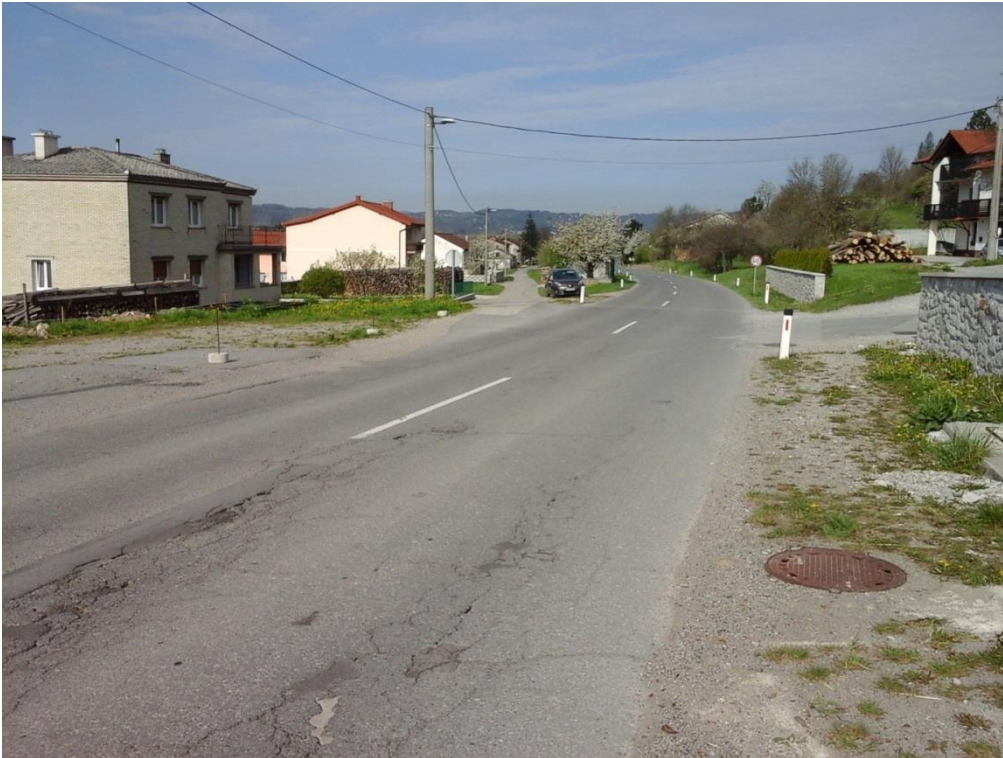
Slika 11 a: Prečkanje ceste iz naselja Jasen

Cesta nima prehoda za pešce, na katerem bi učenci varno prečkali cesto, da bi lahko nadaljevali pot do šole po varnejši, manj prometni površini do šole.