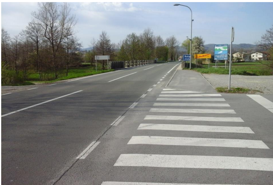
Slika 6: Bazoviška cesta

Na tem delu ceste se odvija hiter promet, zato priporočamo, da učenci nadaljujejo pot po pločniku in prečkajo cesto na zaznamovanem prehodu za pešce in tako poskrbijo za svojo varnost.