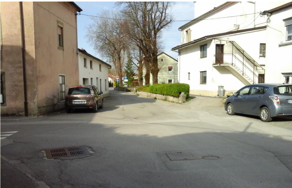
Slika 10: Levstikova ulica

Upoštevajo naj pravila prečkanja ceste na prehodu za pešce.