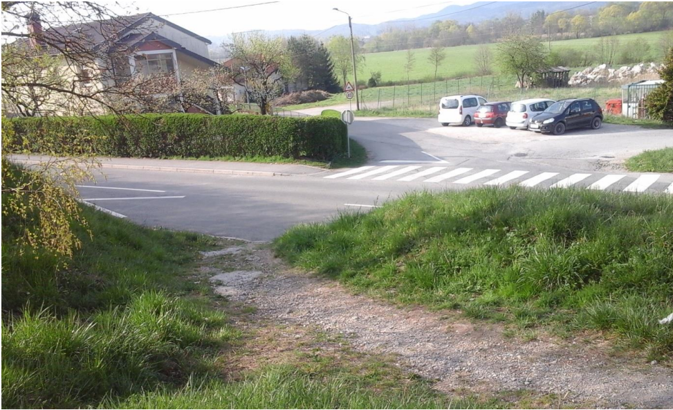
Slika 5 b: Podgrajska ulica

Na vozišču so narisane le talne označbe z znakom šole. Učenci ki prihajajo iz te smeri prečkajo cesto ne delu, kjer ni označenega prehoda za pešce.