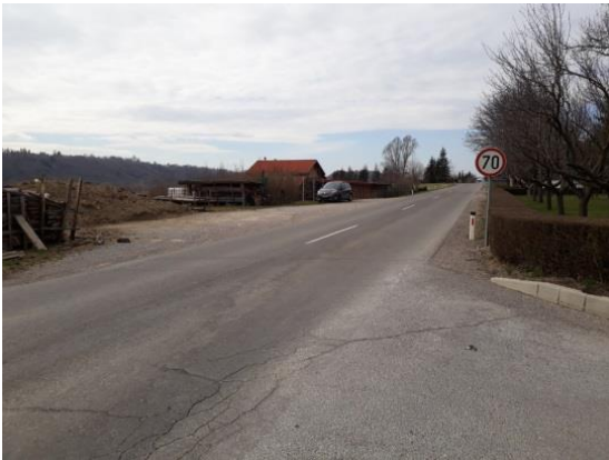
Slika 20 a