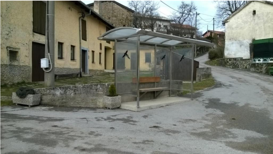
Slika 13: Gornji Zemon

Slika prikazuje postajališče na Gornjem Zemonu. Ob postajališču ni pločnika, talnih označb in table. Predvidevamo, da je to središče vasi, kjer je povečan promet.