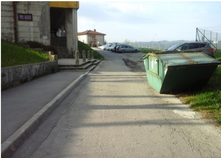
Slika 1 a: Vhod v športno dvorano

Nevarna mesta - točke za učence pešce , na katerih morajo biti učenci pešci, še posebej previdni.