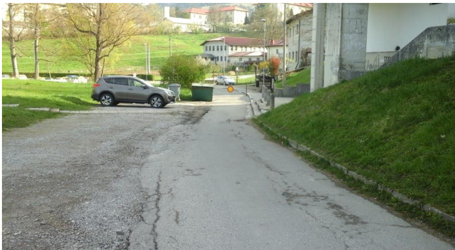
Slika 1 b: Prostor pred športno dvorano

Pločnik ni speljan v celoti do šole. Del prostora zavzemajo parkirani avtomobili, vendar parkirišče ni urejeno. Avtomobili so pogosto parkirani tudi pred vstopom na šolsko igrišče.