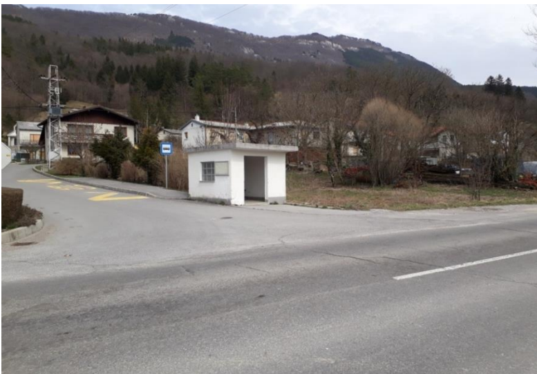
Slika 23: Jablanca

Na sliki je postajališče v naselju Jablanca, ki je namenjeno ustavljanju avtobusa v obe smeri. Je primerno označeno s prometnimi znaki, talnimi označbami in nadkrito čakalnico.