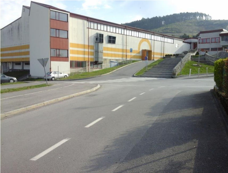
Slika 2: Glavni vhod v šolo

Prečkanje po prehodu za pešce, je večkrat zaradi povečanega promet v jutranjih urah in nespoštovanje pravil vožnje voznikov (krožno obračanje, ustavljanje na prehodu za pešce...) oteženo in s strani učenca pešca nevarno.