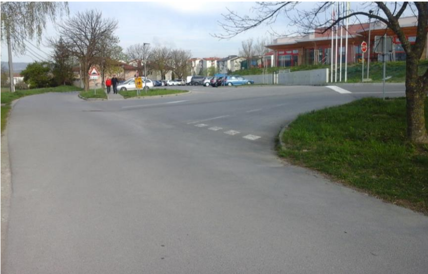
Slika 3: Prehod čez cesto, ki vodi na šolsko parkirišče

Pešci naj previdno prečkajo cesto na prehodu za pešce.