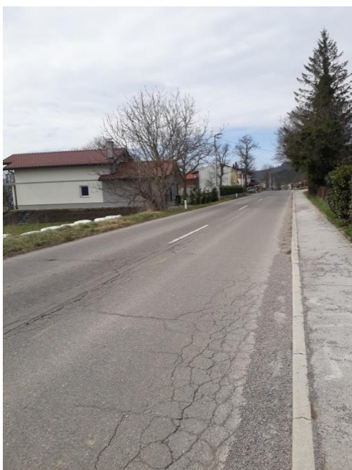
Slika 21 b: Vrbovo