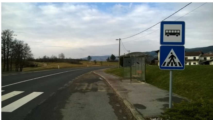
Slika 15 a: Dolnji Zemon (Zemonska Vaga), smer Ilirska Bistrica