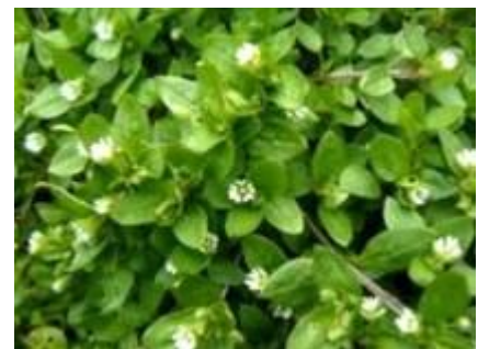
Kurja čreva - navadna zvezdica

naberemo navadno zvezdico (trava) in jo posvremo na olivnem olju. Nato jo ovijemo v krpo in držimo na plućih dokler se krpa ne ohladi.