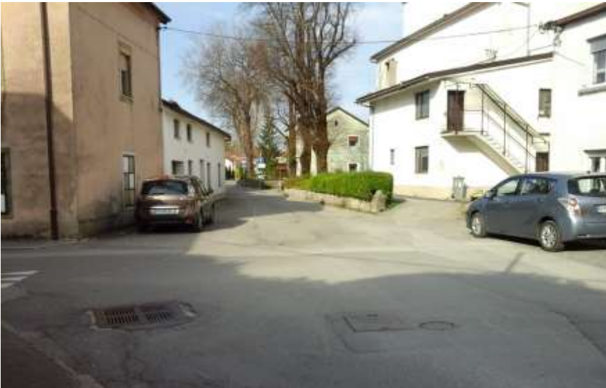
Slika 10: Levstikova ulica

Upoštevajo naj pravila prečkanja ceste na prehodu za pešce.