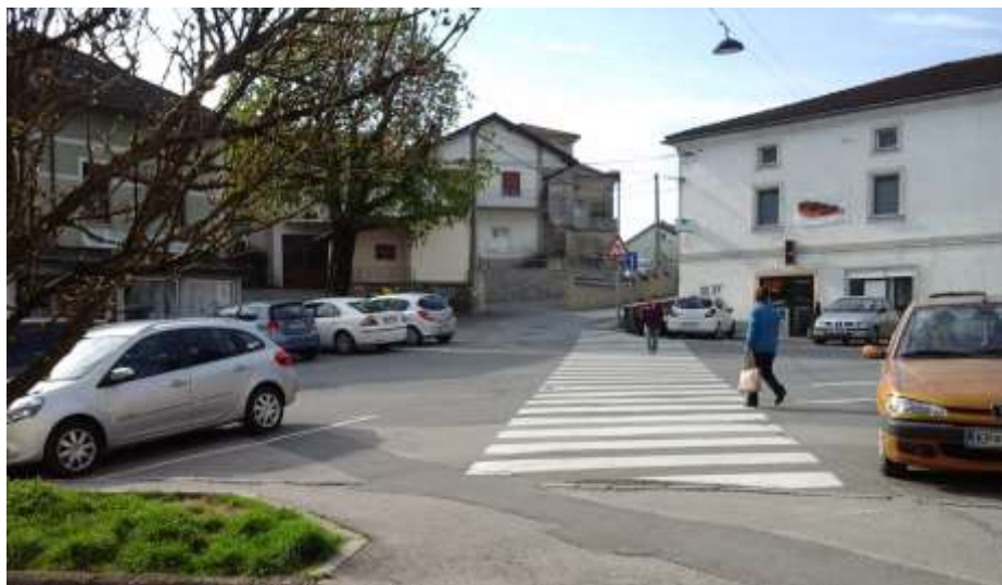
Slika 8: Stičišče Adamičeve, Cankarjeve in Rozmanove ulice

Učenci, ki prihajajo iz Adamičeve ulice nimajo zaznamovanega prehoda za pešce, po katerem bi varno nadaljevali pot do šole, po pločniku v Rozmanovi ulici.