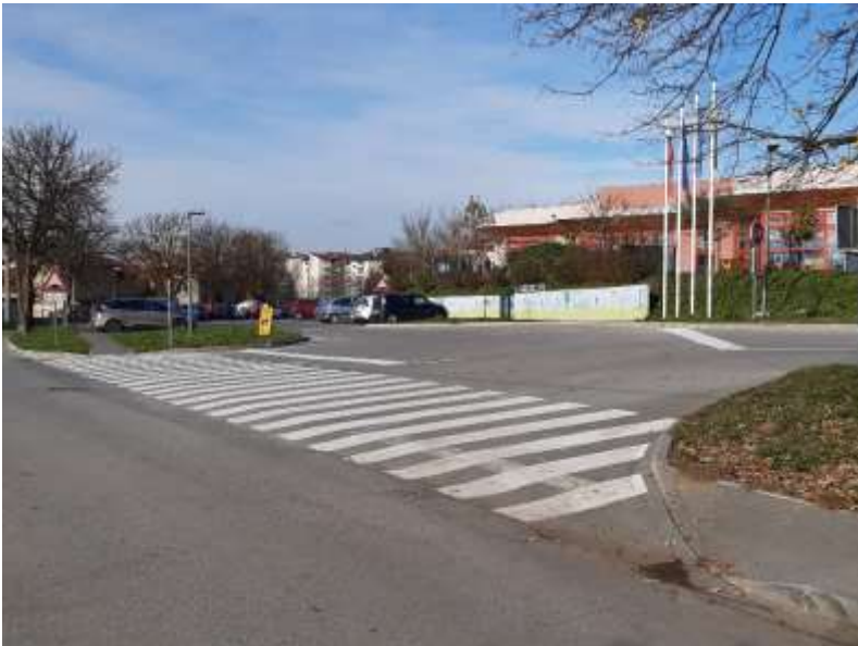
Slika 3: Prehod čez cesto, ki vodi na šolsko parkirišče

Pešci naj previdno prečkajo cesto na prehodu za pešce.