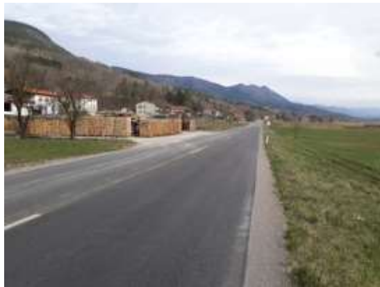
Slika 20 b