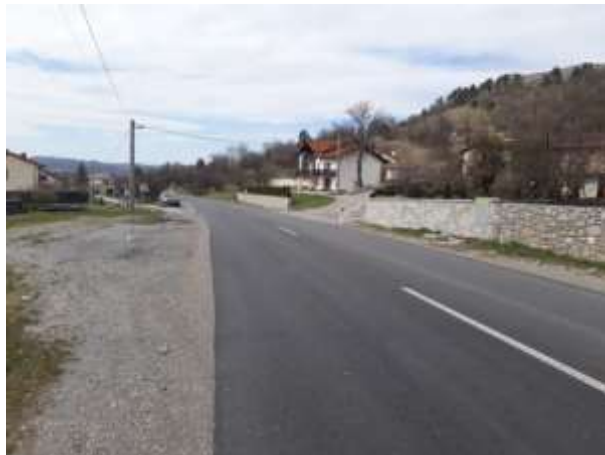
Slika 20 d

Na slikah je prikazan odsek ceste smer Zabiče – Ilirska Bistrica z mestom, kjer ustavlja šolski avtobus v obe smeri. Na fotografiji je razvidno, da postajališče ni označeno, je brez prometnih znakov in talnih označb. Mesto leži ob cesti, kjer se odvija hiter promet, zato zaključujemo, da je nevarno za uporabnike. Na tem delu odseka ni v bližini nobenega prehoda za pešce, kar otežuje varno prečkanje ceste učencem na drugi strani. Postajališče je z vidika prometne varnosti neurejeno.