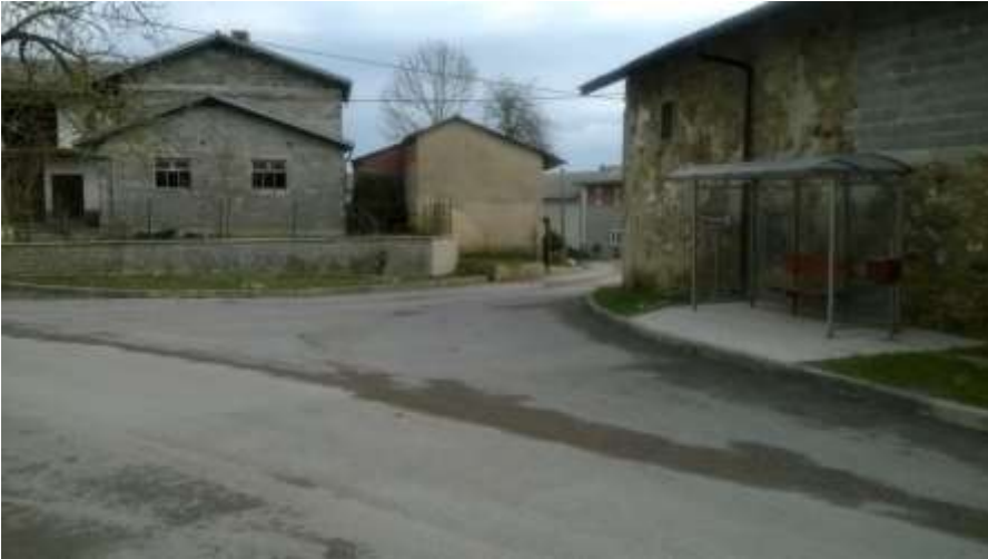
Slika 18 b: Velika Bukovica

Sliki prikazujeta postajališče na Veliki Bukovci. Ob postajališču ni pločnika, talnih označb in table.