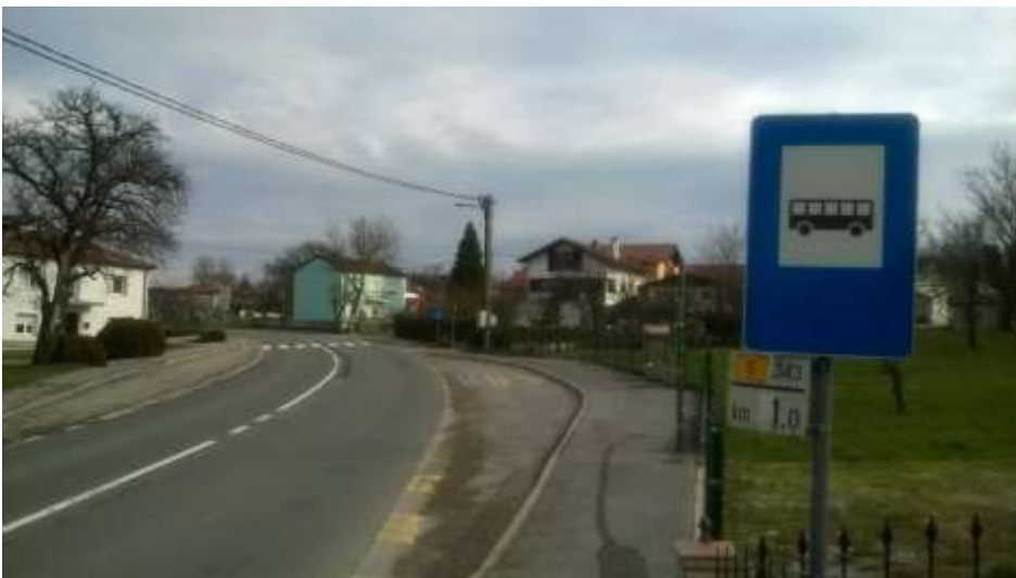
Slika 16 b: Koseze, smer Jelšane

Postajališče je z vidika prometne varnosti urejeno. Ima talne označbe, obveščevalno tablo, dostop po pločniku in urejen prehod za pešce. Postajališče stoji ob glavni magistralni cesti za Reko (Hrvaška), promet je povečan in se hitreje odvija. Učence opozarjamo na povečano previdnost ob prečkanju ceste!