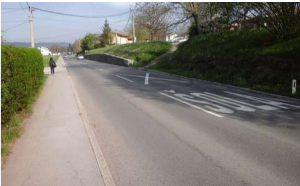
Slika 5 a: Podgrajska ulica

Pri prečkanju dela cestišča bodite previdni in se prepričajte da na cesti ni avtomobila.