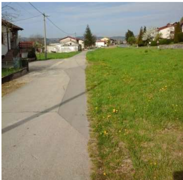
Slika 11 b: Manj prometna površina ob glavni cesti

Cesta je ozka, manj prometna vendar nima pločnika.