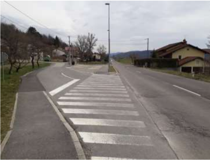
Slika 21 a: Vrbovo