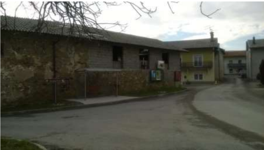
Slika 18 a: Velika Bukovica