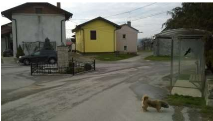
Slika 14 b: Dolnji Zemon

Sliki prikazujeta postajališče na Dolnjem Zemonu. Ob postajališču ni pločnika, talnih označb in table. Predvidevamo, da je to središče vasi, kjer je povečan promet.