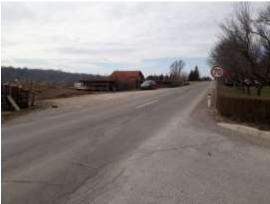
Slika 20 a