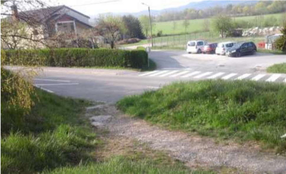
Slika 5 b: Podgrajska ulica

Na vozišču so narisane le talne označbe z znakom šole. Učenci ki prihajajo iz te smeri prečkajo cesto ne delu, kjer ni označenega prehoda za pešce.