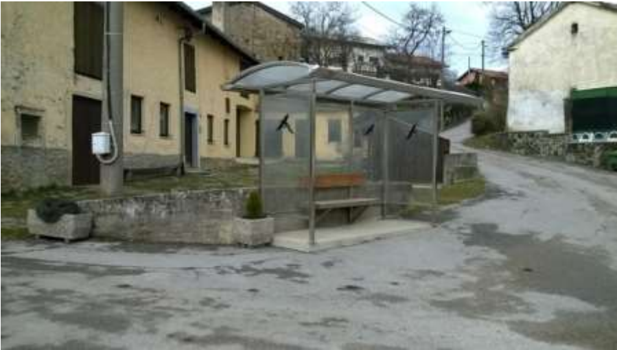
Slika 13: Gornji Zemon

Slika prikazuje postajališče na Gornjem Zemonu. Ob postajališču ni pločnika, talnih označb in table. Predvidevamo, da je to središče vasi, kjer je povečan promet.