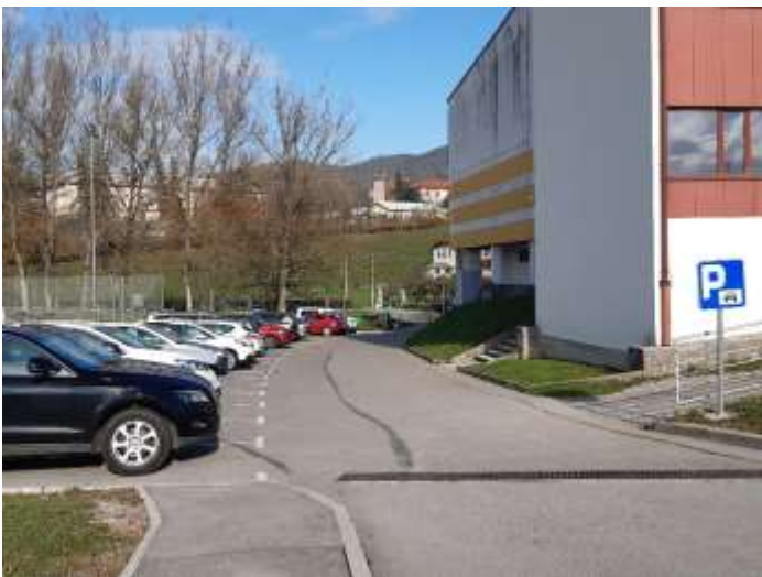
Slika 1 b: Prostor pred športno dvorano

Pločnik ni speljan v celoti do šole. Del prostora zavzemajo parkirani avtomobili. Avtomobili so pogosto parkirani tudi pred vstopom na šolsko igrišče.