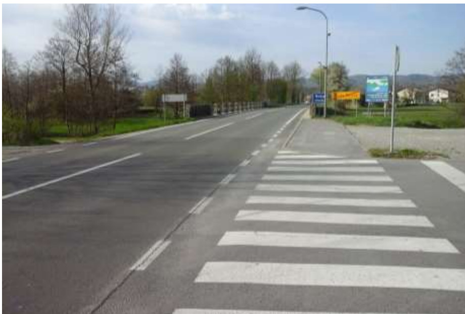
Slika 6: Bazoviška cesta

Na tem delu ceste se odvija hiter promet, zato priporočamo, da učenci nadaljujejo pot po pločniku in prečkajo cesto na zaznamovanem prehodu za pešce in tako poskrbijo za svojo varnost.