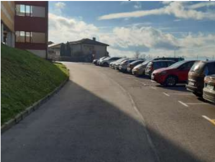
Slika 1 a: Vhod v športno dvorano

Nevarna mesta - točke za učence pešce, na katerih morajo biti učenci pešci, še posebej previdni.