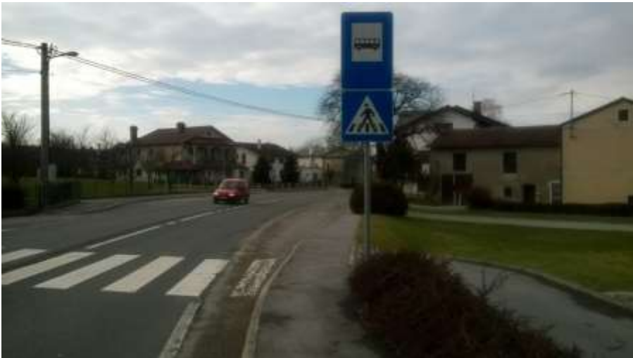
Slika 16 a: Koseze, smer Ilirska Bistrica