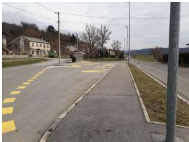
Slika 21 c: Vrbovo

Vrbovo ima urejeno postajališče, ki pa se za obe smeri nahaja na eni strani. Učenci z druge strani prometne ceste nimajo označenega prehoda za pešce.