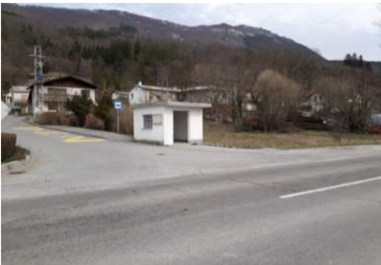
Slika 23: Jablanca

Na sliki je postajališče v naselju Jablanca, ki je namenjeno ustavljanju avtobusa v obe smeri. Je primerno označeno s prometnimi znaki, talnimi označbami in nadkrito čakalnico.