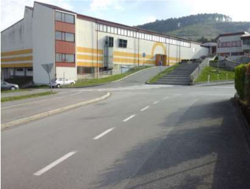
Slika 2: Glavni vhod v šolo

Prečkanje po prehodu za pešce, je večkrat zaradi povečanega promet v jutranjih urah in nespoštovanje pravil vožnje voznikov (krožno obračanje, ustavljanje na prehodu za pešce...) oteženo in s strani učenca pešca nevarno.