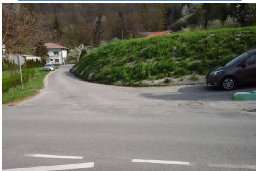
Slika 12: Rozmanova ulica

Upoštevajo naj pravila hoje v naselju, kjer ni pločnika.