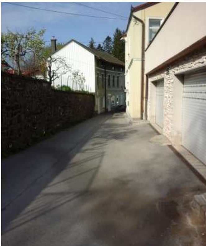
Slika 7: Adamičeva ulica