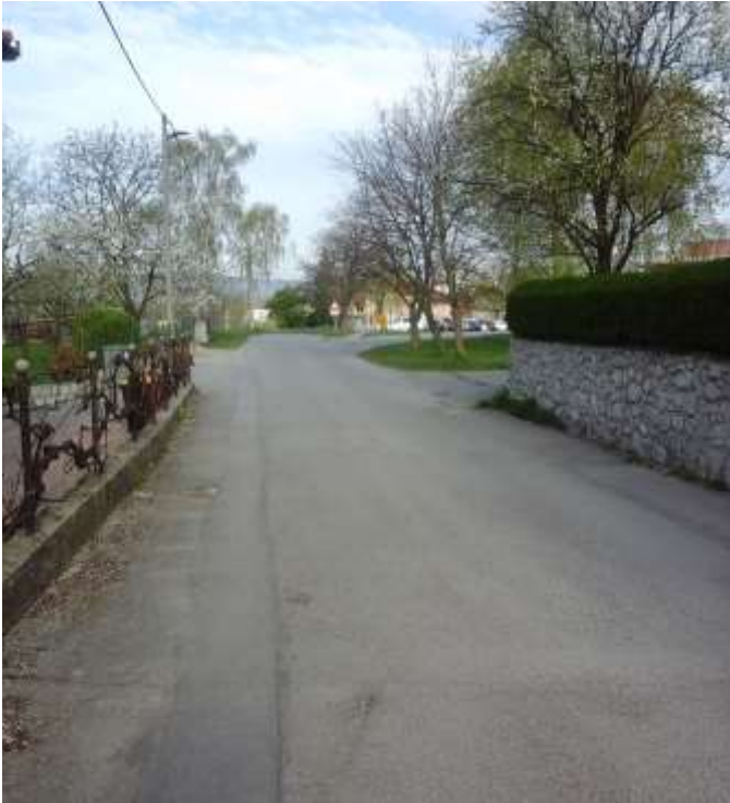
Slika 4: Del Rozmanove ulice po kateri prihajajo peš učenci iz Jasena.

Ulica je ozka in nima pločnika. Pri prehodu pešcev na pločnik, se prečka cesto, ki pelje na šolsko parkirišče. Tu ni prehoda za pešce in v jutranjih urah je ta del ceste precej obremenjen.