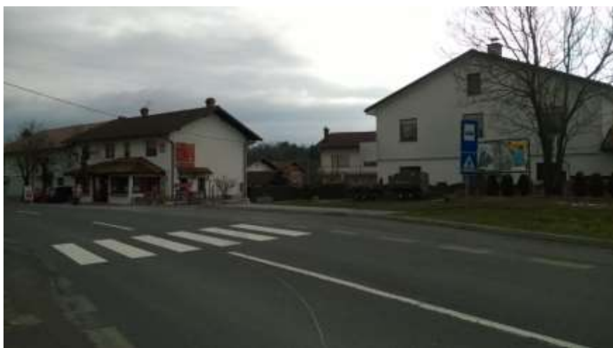
Slika 15 b: Dolnji Zemon (Zemonska Vaga), smer Jelšane

Postajališče je z vidika prometne varnosti urejeno. Ima talne označbe, obveščevalno tablo, dostop po pločniku, urejen prehod za pešce in nadstrešek. Postajališče stoji ob glavni magistralni cesti za Reko (Hrvaška), promet je povečan in se hitreje odvija.