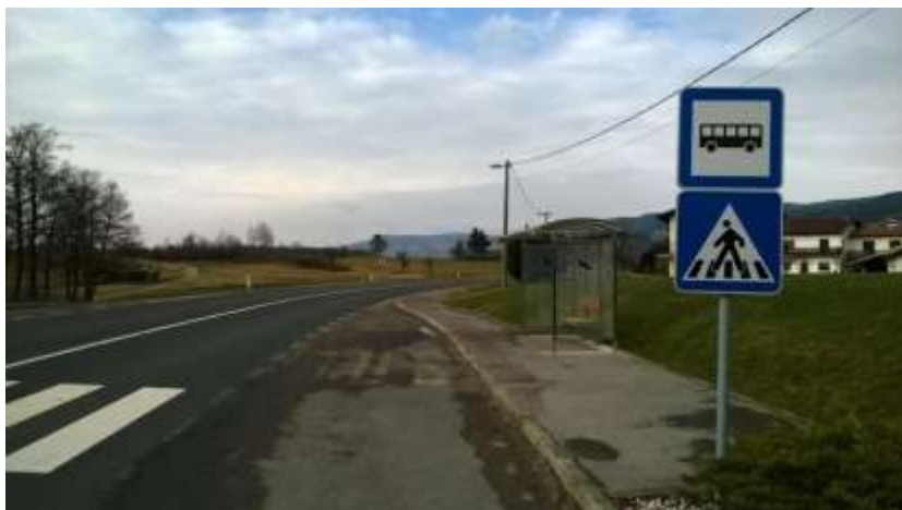
Slika 15 a: Dolnji Zemon (Zemonska Vaga), smer Ilirska Bistrica