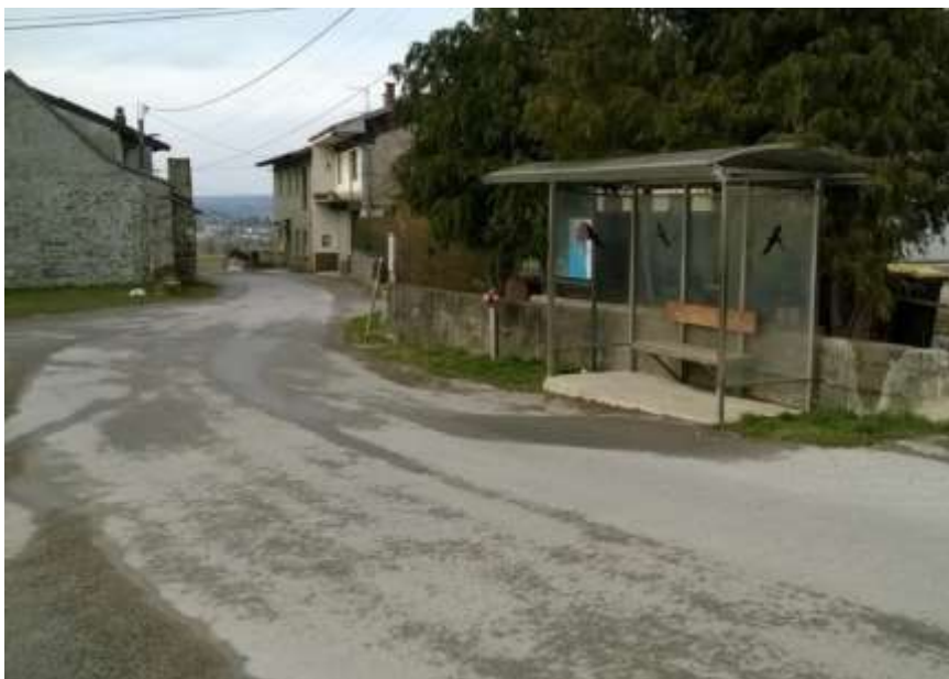
Slika 14 a: Dolnji Zemon