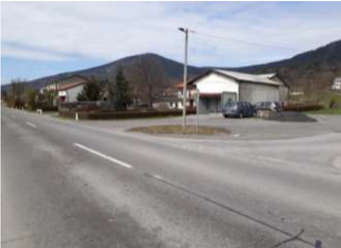
Slika 22: Vrbica

Na sliki je postajališče, kjer ustavi šolski avtobus. Nima nobene talnih oznak niti druge prometnih označbe, ki bi opozarjale na postajališče. Ker pa je mesto postajališče odmaknjeno s prometne ceste, je z vidika prometne varnosti samo slabo označeno.