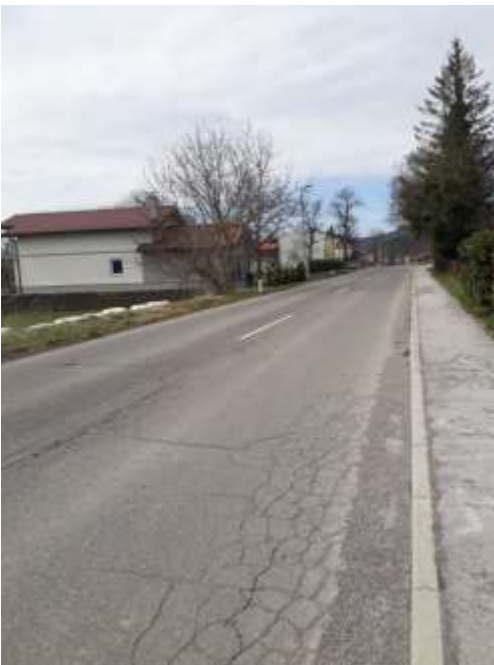
Slika 21 b: Vrbovo