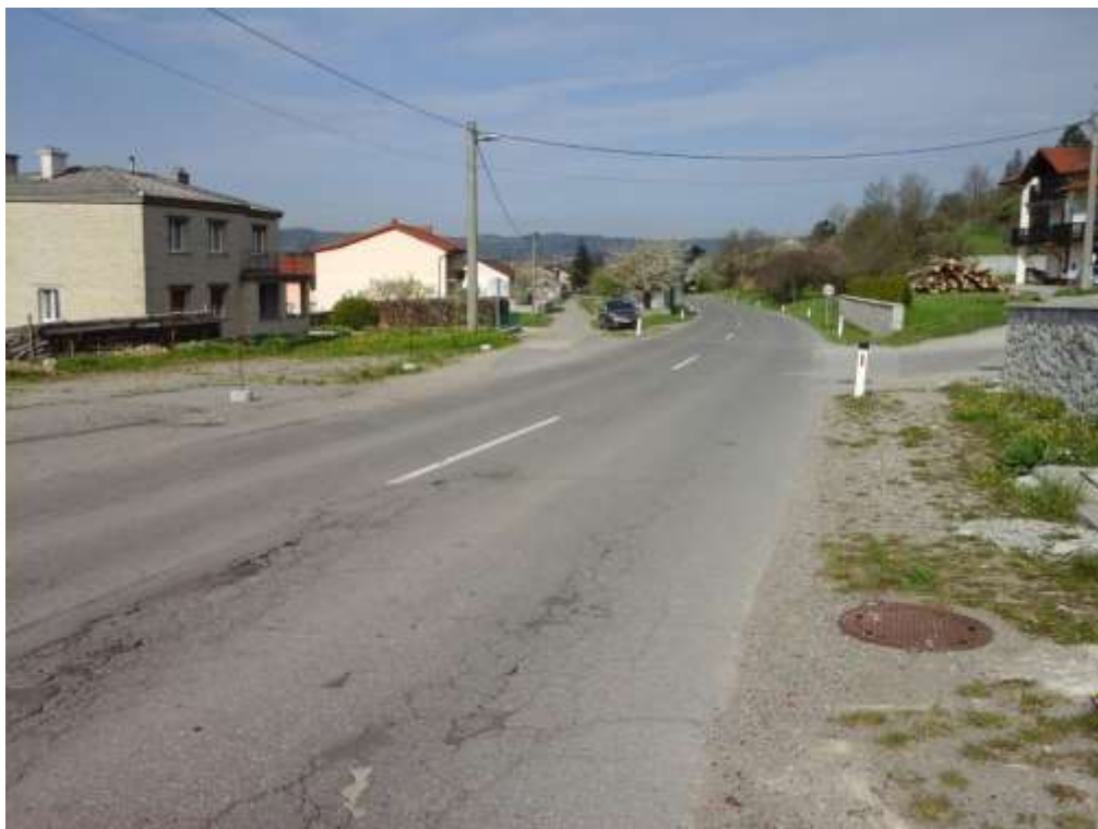
Slika 11 a: Prečkanje ceste iz naselja Jasen

Cesta nima prehoda za pešce, na katerem bi učenci varno prečkali cesto, da bi lahko nadaljevali pot do šole po varnejši, manj prometni površini do šole.