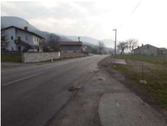
Slika 20 c