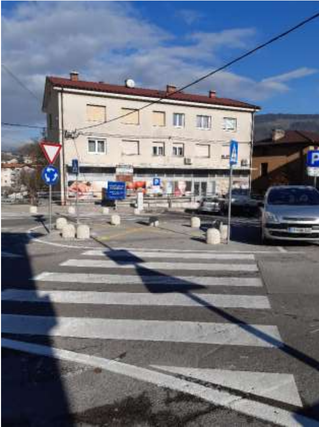
Slika 9: Prehod pred pošto