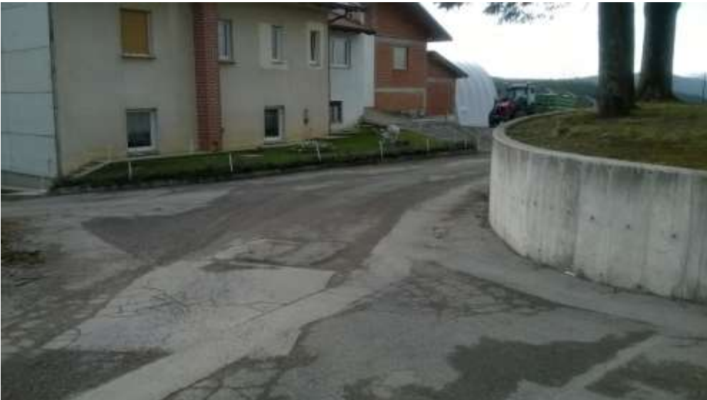
Slika 19: Soze (pri cerkvi)

Na sliki je mesto, kjer ustavi šolski avtobus. Nima nobene talne niti druge prometne označbe, ki bi opozarjale na postajališče. Postajališče je z vidika prometne varnosti neurejeno.